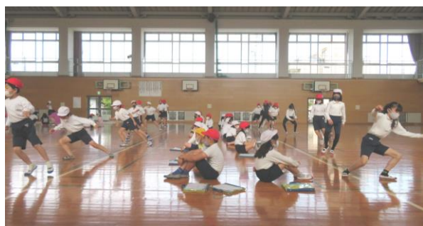
スポーツテストがんばりました！

さて、いよいよ野外活動に向けての準備が本格的に始まっていきます。仲間とともに考えたり、活動したりする中で、班や学級・学年の仲間たちと協力して過ごすことの大切さを体験できる行事にしていきたいと考えています。保護者の皆様には、初めての宿泊行事ということで、ご心配なこともあるかと思います。何か気になることがあれば、担任にご相談ください。詳しい日程や持ち物などにつきましては、5月28日（金）の説明会にてお話しさせていただきます。是非、ご参加いただきますようお願いいたします。